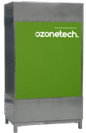
냄새를 제거해야 하는데 공간이 한정적인가요?

컴팩트한 디자인과 산업용 등급의 고성능 탈취를 결합한 이 제품은 기획자와 컨설턴트에게 새로운 옵션을 제공합니다. 지하 주차장 및 마당에서 탈취된 가스가 배출되므로 더욱 저렴하고 간단한 덕트 공사가 가능합니다.