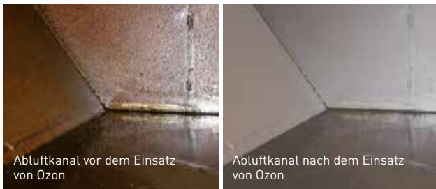
Abluftkanal vor dem Einsatz von Ozon

Kochgerüche von Restaurants sind nicht immer willkommen und können zu Beschwerden von Nachbarn, Mietern und Hotelgästen führen. Ozon minimiert Gerüche und somit mögliche Unannehmlichkeiten in der Umgebung.